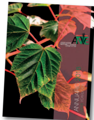
A sinistra: un momento dell'incontro di presentazione alla stampa in occasione di Myplant del nuovo Annuario 2016 di Anve (sotto).

33 NUOVI SOCI EFFETTIVI, PER UN TOTALE DI OLTRE 40 AZIENDE, E 14 NUOVI SOCI SOSTENITORI E PARTNER, PER UN TOTALE DI 16, ANIMANO L'ASSOCIAZIONE NAZIONALE VIVAISTI ESPORTATORI