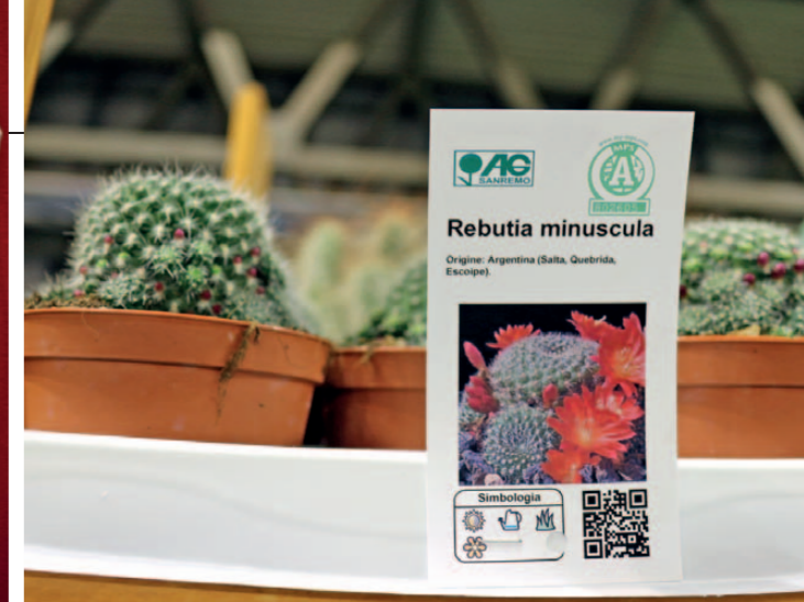
Sopra: i coprivaso in legno "Opera 16" per piante verdi e fiorite presentati dalla Vigo Gerolamo di Albenga (SV). A sinistra e nel tondo: attira lo sguardo e anche l'olfatto la Boronia crenulata presentata da Apulia Plants di Terlizzi (BA). Una "bellezza" tipicamente mediterranea che fiorisce ininterrottamente tutto l'anno, regalando una grande profusione di fiorellini; altra sua caratteristica il fogliame profumato. Sopra, a destra: il QR Code di AG Sanremo. Di fianco: Flower Candle la novità della danese Offer Madsen in puro stile nordico.