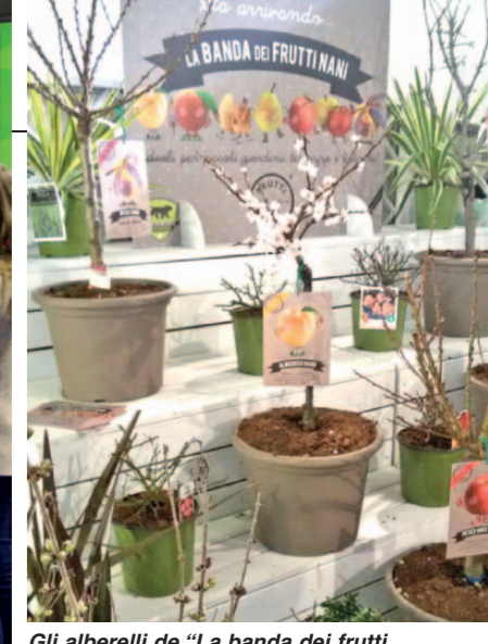
Gli alberelli de "La banda dei fruttinani" presentati dai Vivai Leonesa. Sotto: Euphorbia milii "Hera".