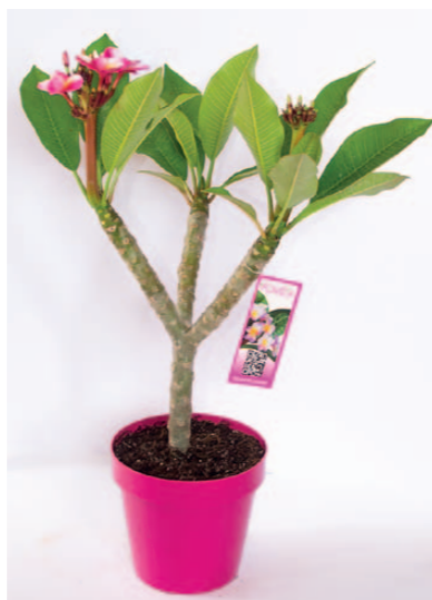
Sopra e a destra: la Plumeria rubra della Floricoltura Oro Verde. A sinistra: uno scorcio dello stand della Floricoltura Billo interamente dedicato ai dianthus.

Floricoltura Billo , azienda veneta specializzata nella produzione di dianthus, ha esposto alcune delle numerose varietà che negli ultimi tempi stanno facendo tendenza: quelle da roccioso, le ornamentali inglesi, dai lunghi steli, e i garofani botanici. Che anche le essenze più classiche possano offrirsi in modi innovativi lo dimostra la Compagnia del Lago di Verbania Fondotoce, che ha reso più attuali le